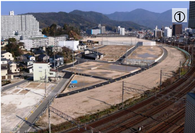
都市計画道路 青崎中店線